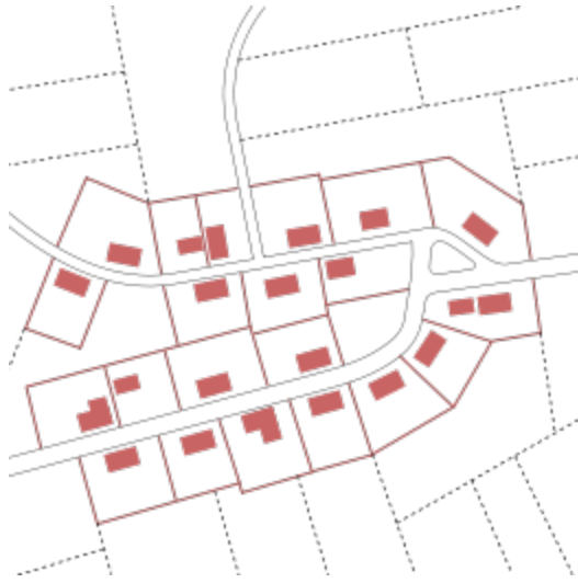
Kupetinio kaimo schema